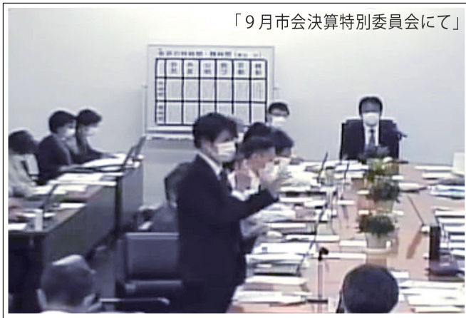
「9月市会決算特別委員会にて」

今後も皆さまのお声をお聞きし、京都市の子育て環境がさらに良くなるように、声を上げて参ります!!